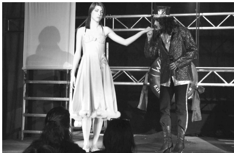
Pamje nga shfaqja